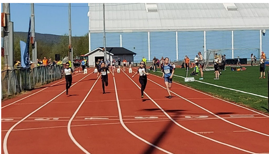
60 meter G11

For at vi kunne arrangere Narvik-Lekene fikk vi god hjelp fra dommere, startere og tidtakere fra våre naboklubber. Vi takker så mye for støtte og hjelp!