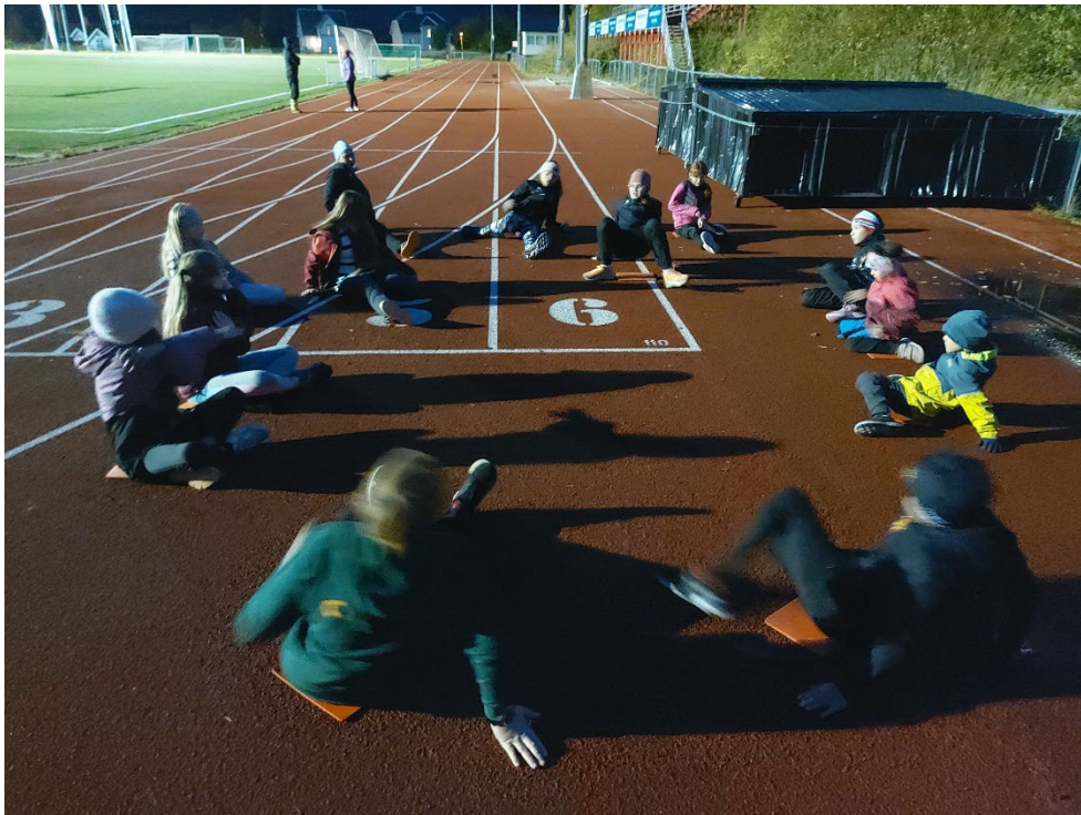
Uttøying etter trening høst 2023