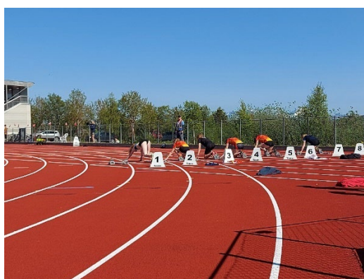
J15 100 meter