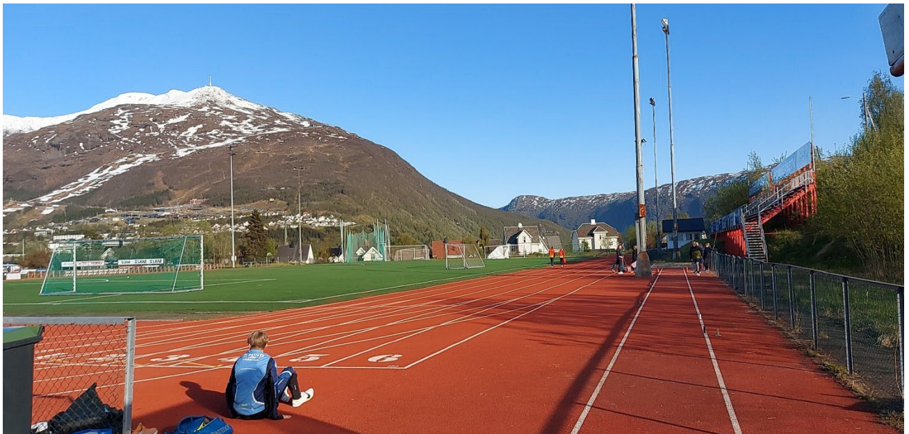
Bildet fra Stadion tidlig før Narviklekene 2023