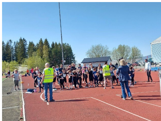
Bedre vær på Narviklekene 2023 her fra rekrutt liten ball