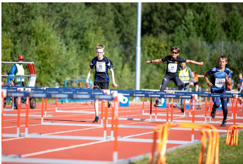
Sortlandsmesterskapet Hekk G11

19.-20. august ble Sortlandsmesterskapet av og Narvik IL deltok med 4 rekrutter, 1 G11, 1 J11, 1 J13, 1 J15 og 2 menn veteran.