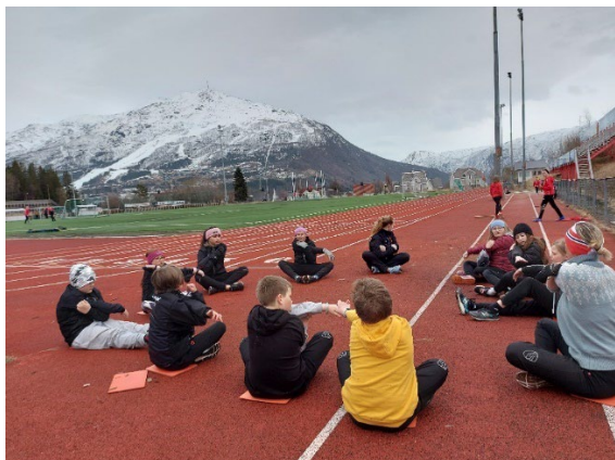
Våren 2023 var det kaldt å trene ute

Lagets viktigste kommunikasjon med medlemmene og omgivelsene er gjennom vår hjemmeside www.narvikil.no og på Facebook der vi har en åpen side Narvik IL og to lukkede grupper hvor vi informerer om trening. En gruppe for rekrutt- og mellomgruppa og en for de aktive. Her legges informasjon om trening, terminliste, arrangementer, dugnadsarbeid og nyheter ut. I tillegg har laget en åpen side på Facebook der vi legger ut informasjon om det som skjer i klubben.